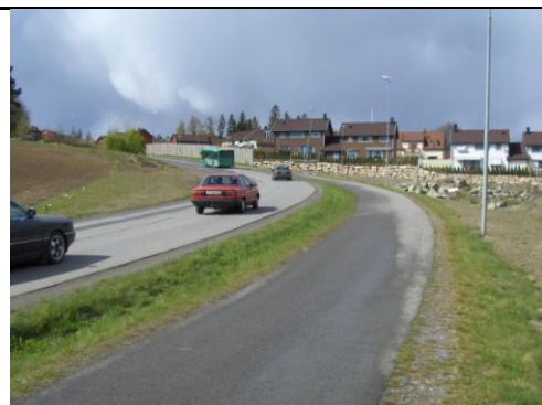
Kontrast: Adkomstvei til Brånås boligfelt i Skedsmo kommune.

Tumyrhaugen vel Postboks 27, 1482 Nittedal